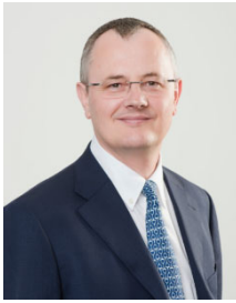
ニコラ キュドレ・モルー Ph.D ソルベイ社 最高技術責任者(CTO)